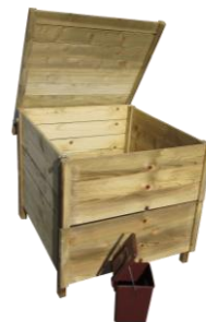
Modèle bois 575 litres