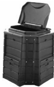
Modèle plastique 400 litres